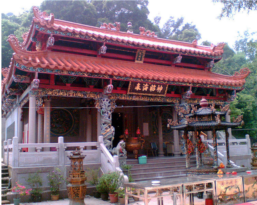
香港地名天后之天后宮