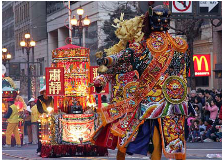
舊金山媽祖廟現在不大，但日益興隆，其之新年大遊行最受歡迎