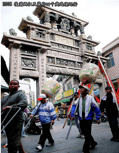
2008 後浦媽祖及蘇府四千歲遶境巡安