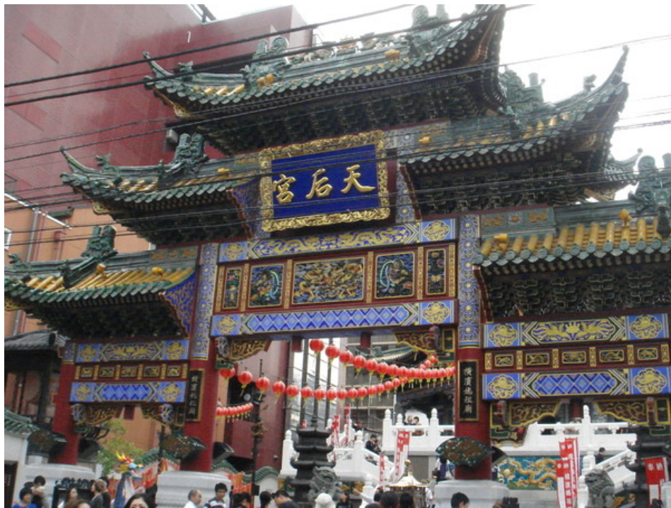
日本橫濱近年新建之媽祖廟