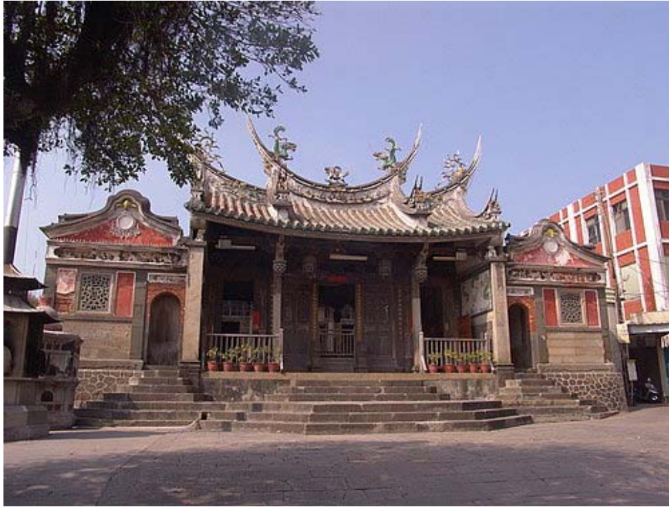
澎湖天后宮有 400 年歷史，並留在 400 年前荷蘭的紀錄裏。