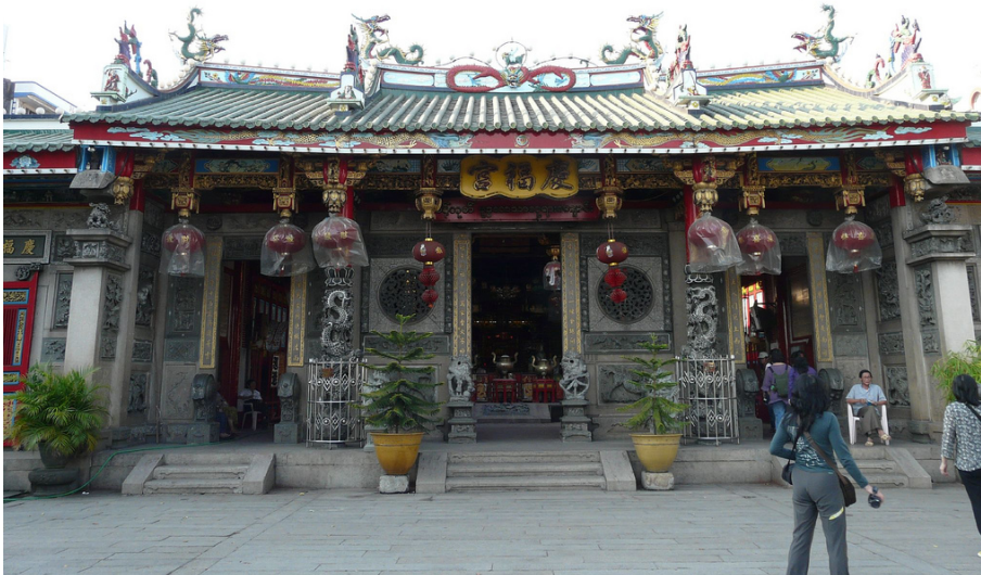
緬甸仰光之媽祖廟—慶福宮