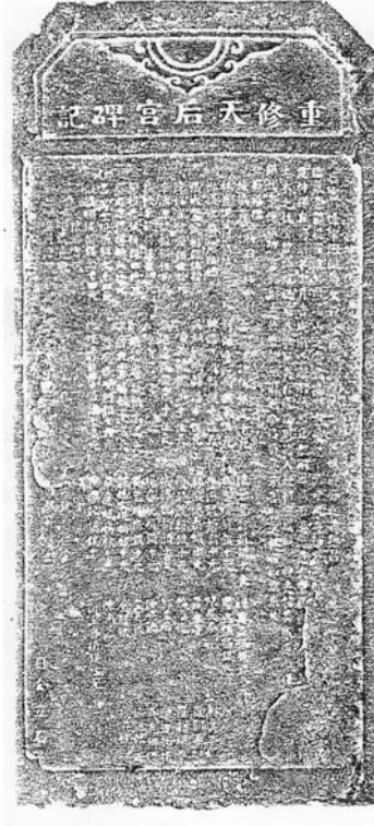
六一、碑名：重修天后宮碑記

年代：道光四年二月（西元一八二四年） 地址：旗山鎮洲里永福街23巷16號 天后宮 位置：三川門左壁 材質：花崗岩 形式：額刻碑題 尺寸：縱14公分 橫73公分