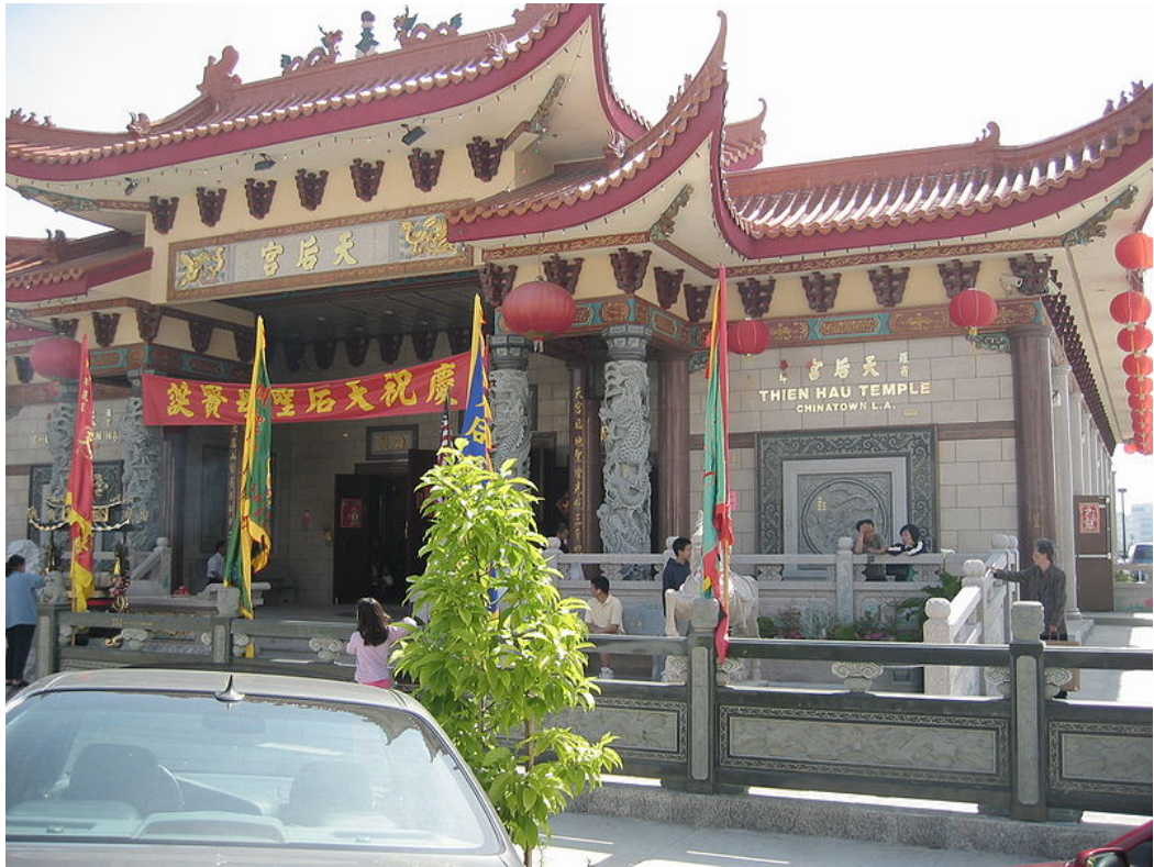
美國洛杉磯中國城之天后宮