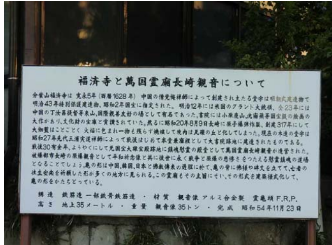
越南霞漳會館介紹媽祖之史績 日本長崎福濟寺建於 1628 年，媽祖與觀音皆供奉