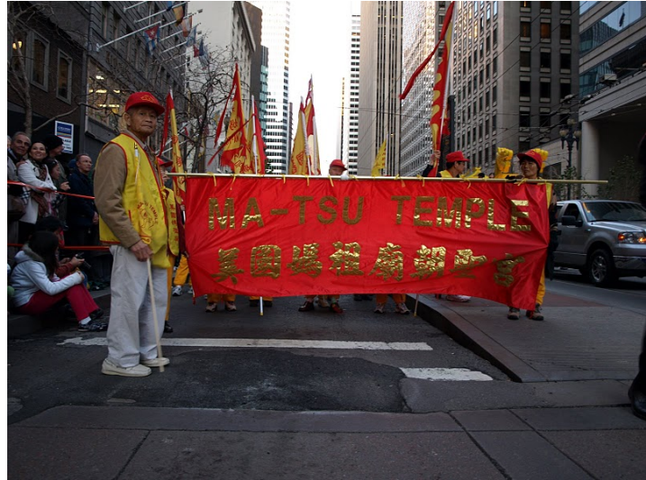
(左左 2008 金門後浦媽祖及蘇府四千歲遶境巡安 (右)美國舊金山媽祖廟遶境