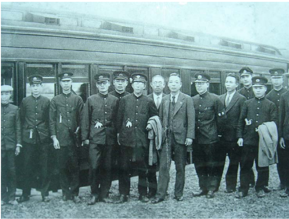
1937年(民國26年)3月21日，板橋火車站開往北港媽祖的進香團體及專用列車。 這可能是臺灣最早的媽祖進香照片