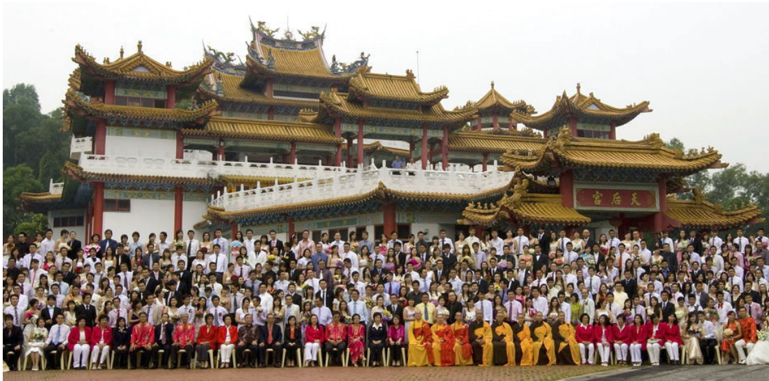
馬來西亞吉隆坡之媽祖廟一天后宮。此圖攝於2009年9月29日： 天后宮為540對馬來西亞華裔新人舉行集團婚禮，分上下午，此照片有200對。 中華南方各種方言相同，九與久同音，此日辦婚禮有久久長長之意。