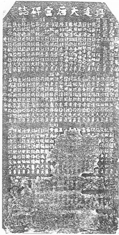
六〇、碑名：興建天后宮碑誌

年代：道光四年二月（西元一八二四年） 地址：旗山鎮洲里永福街23巷16號 天后宮 位置：三川門左壁 材質：花崗岩 形式：額刻碑題 尺寸：縱14公分 橫73公分