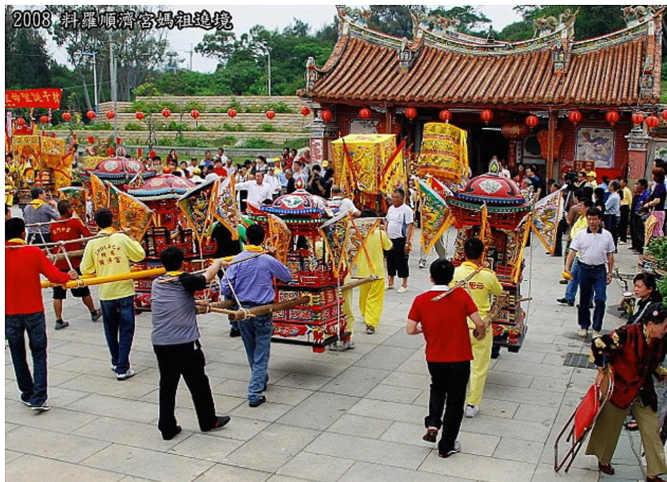
2008 金門料羅順濟宮媽祖遶境